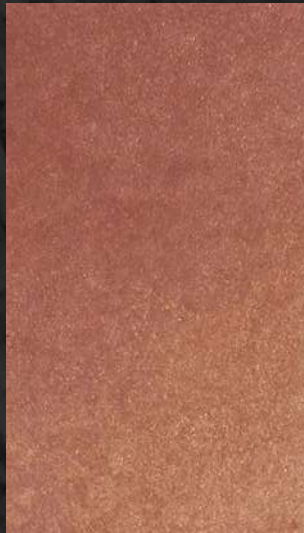
C. 604 ML. 75 CL32 + ML. 25 CL71