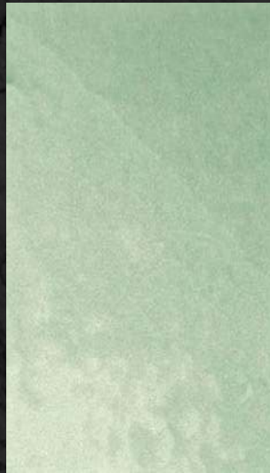
C. 501 ML. 25 CL62