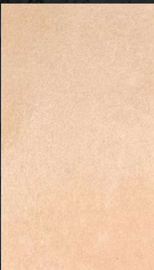
C. 519 ML. 50 CL36