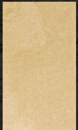
C. 510 ML. 25 CL51 + ML. 25 CL15