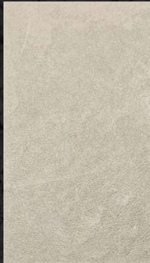
C. 513 ML. 25 CL72