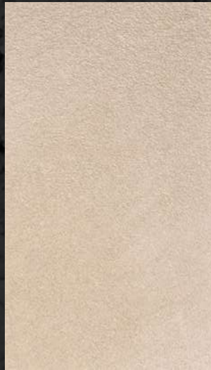
C. 517 ML. 25 CL51