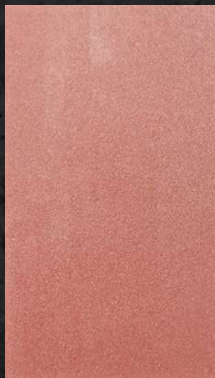
C. 521 ML. 25 CL32 + ML. 50 CL31