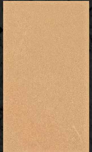
C. 606 ML. 25 CL31