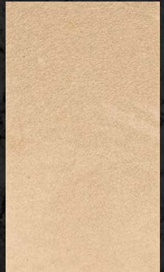
C. 518 ML. 50 CL11 + ML. 25 CL14