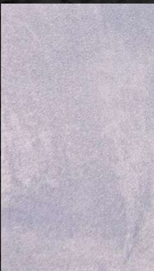
C. 507 ML. 25 CL21 + ML. 25 CL81