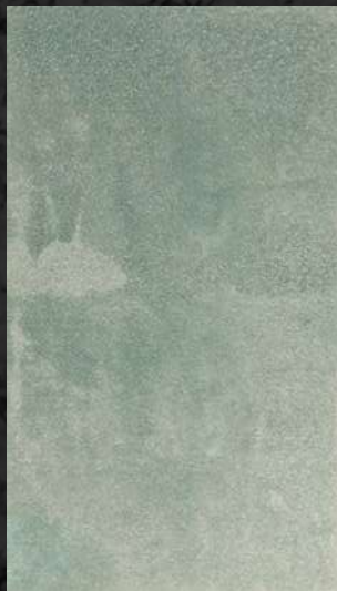
C. 504 ML. 25 CL21 + ML. 25 CL61 + ML. 75 CL65