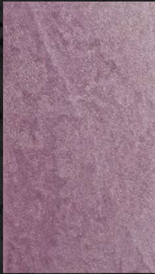
C. 524 ML. 100 CL81 + ML. 25 CL21 + ML. 75 CL32