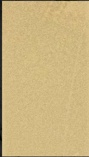
C. 601 ML. 50 CL61