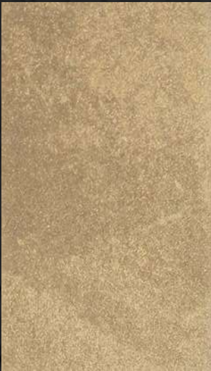
C. 603 ML. 25 CL71