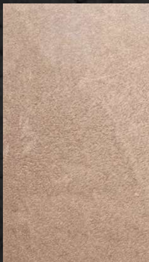
C. 508 ML. 50 CL71