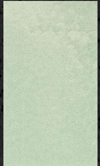
C. 502 ML. 50 CL62