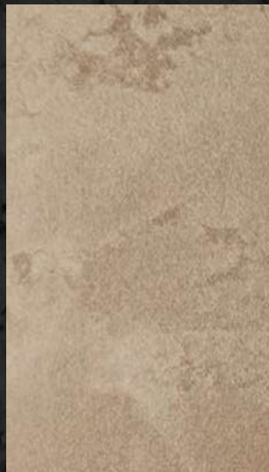
C. 525 ML. 25 CL15 + ML. 25 CL32 + ML. 50 CL72