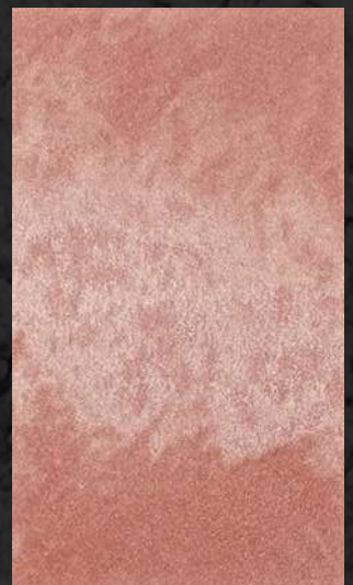
C. 522 ML. 50 CL32 + ML. 200 CL31