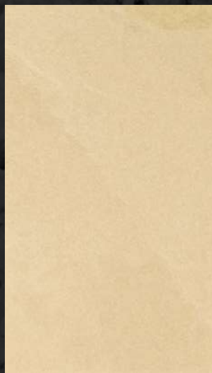
C. 509 ML. 25 CL11