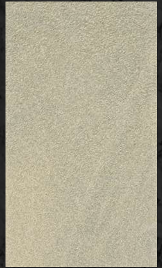
C. 602 ML. 50 CL62 + ML. 50 CL81