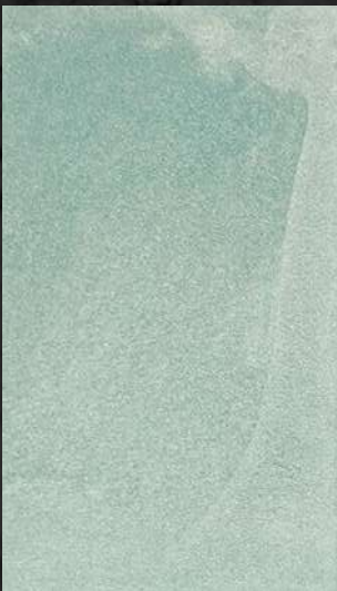
C. 503 ML. 50 CL62 + ML. 25 CL21