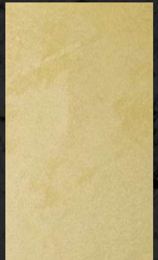
C. 527 ML. 25 CL15