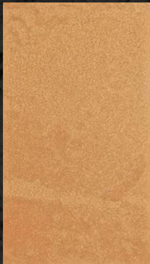
C. 608 ML. 50 CL31 + ML. 75 CL51