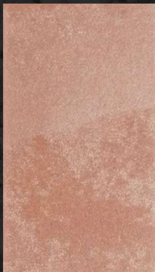
C. 520 ML. 25 CL14 + ML. 50 CL31