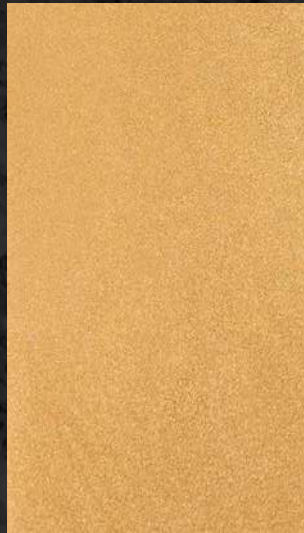
C. 605 ML. 25 CL36