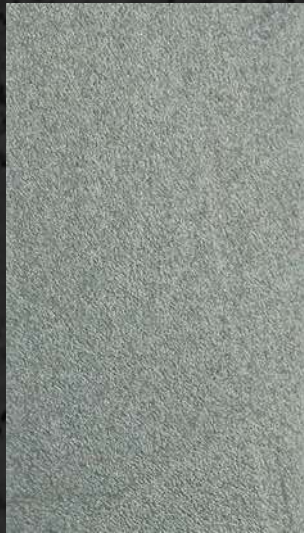
C. 516 ML. 50 CL71 + ML. 50 CL21