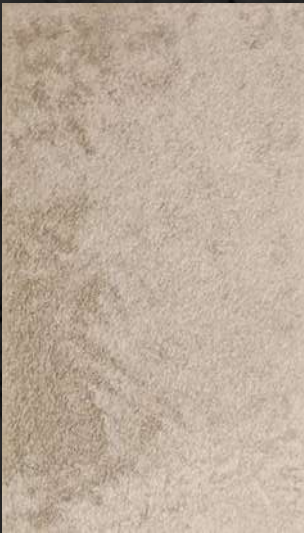
C. 511 ML. 50 CL53 + ML. 25 CL72