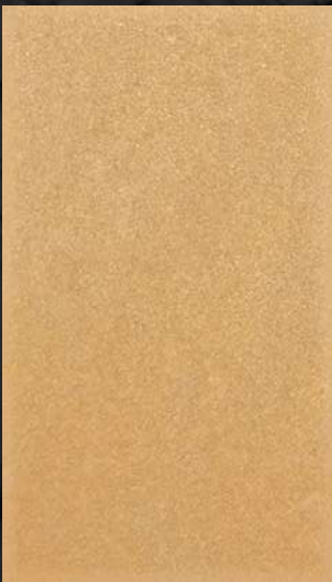
C. 607 ML. 50 CL51