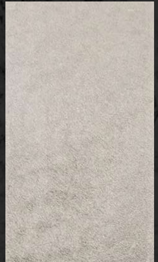
C. 514 ML. 25 CL71