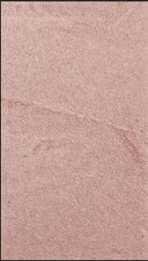
C. 523 ML. 25 CL81 + ML. 25 CL32 + ML. 100 CL31