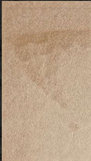
C. 512 ML. 25 CL64 + ML. 100 CL53