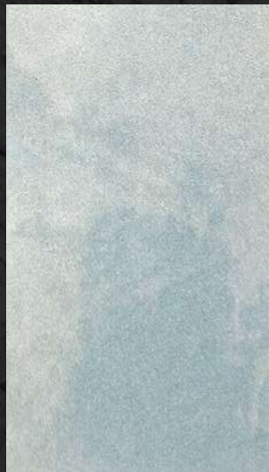
C. 505 ML. 25 CL21