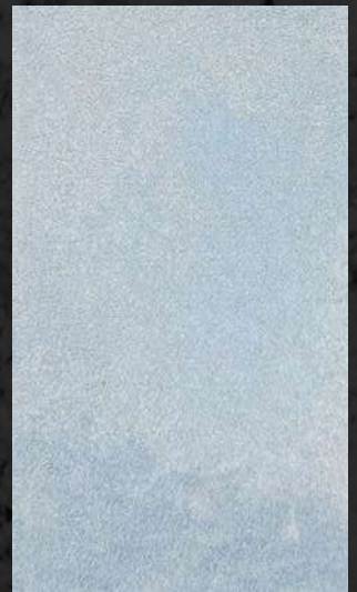
C. 506 ML. 50 CL21